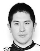
(豊) 34才 111期